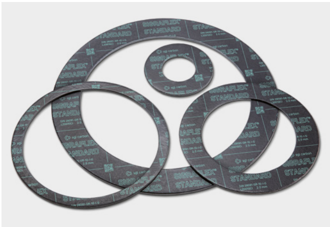
↑ Dichtungen aus SIGRAFLEX STANDARD