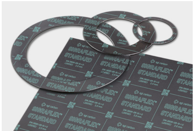
↑ SIGRAFLEX STANDARD Dichtungsplatten und Dichtungen