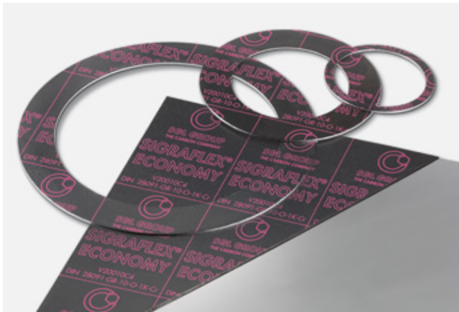
↑ SIGRAFLEX ECONOMY Dichtungsplatten und Dichtungen