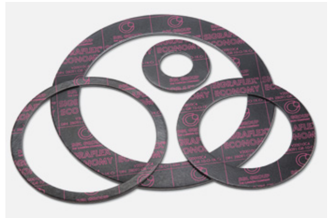
↑ Dichtungen aus SIGRAFLEX ECONOMY